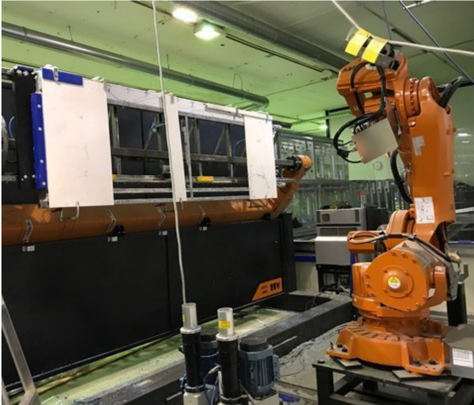
ABB robottisolu "grillillä", poraus/sahaus

ABB robot cell with "grill" and machining unit